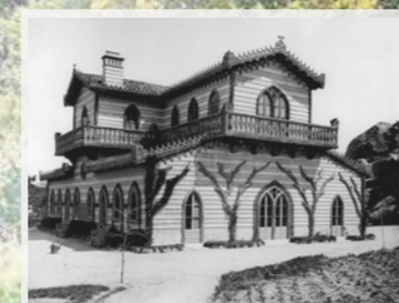
Le Chalet de la Comtesse, après sa construction.

Créateur du Parc et du Palais de Pena, D. Fernando II (1819-85) a épousé en secondes noces (1869) Elise Hensler, Comtesse d'Edla (1836-1929). Ils ont ensemble fait construire le Chalet de la Comtesse et le Jardin qui l'entoure dans la zone occidentale du Parc de Pena entre 1864 et 1869