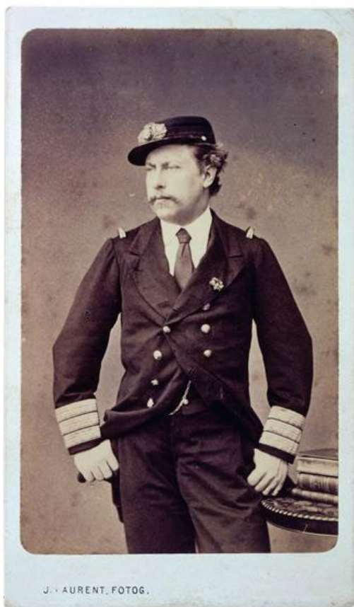
FIG. 1 D. Luís de Bragança, c. 1870

A grande iniciativa de cariz museal tomada por D. Luís no início do seu reinado foi, todavia, a criação de uma galeria de pintura no Palácio da Ajuda, então e pela primeira vez escolhido para residência oficial. Procurando fazer face à dramática incapacidade do Estado neste domínio, sobretudo em relação à Academia de Belas Artes que tardava em abrir a sua galeria de pintura, o monarca lançou-se na organização de uma pinacoteca real, influenciado talvez pelos equipamentos congêneres visitados durante as suas viagens ao estrangeiro, como a Galeria Sabauda de Turim, criada pelo rei Carlos Alberto junto ao